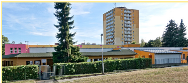
Denní stacionář Chodov Školní 737 357 35 Chodov