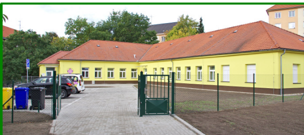
Denní stacionář Sokolov Sokolovská 1508 356 01 Sokolov