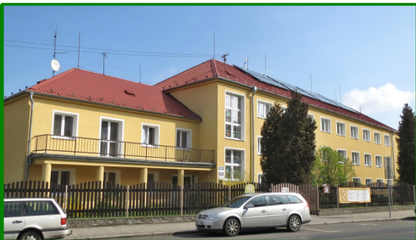
Sociálně terapeutické dílny Sokolov K.H. Borovského 1267 356 01 Sokolov