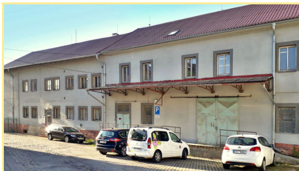
Sociálně terapeutické dílny Chodov Tovární 223 357 35 Chodov